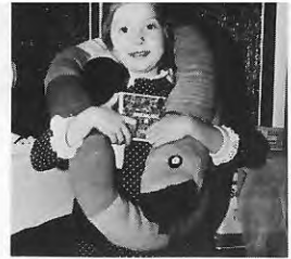
Wo will denn die Schlange mit dem Mädchen hin ?

vor Ihnen. Dieser Betrag wird dem Club zweckgebunden für die Clubhaus-Neugestaltung zur Verfügung gestellt. Wenn man der Damenabteilung auch wiederholt jede Daseinsberechtigung abgesprochen hat (zugegebenermaßen sind wir sportlich nicht so aktiv), so dürften doch auch un-