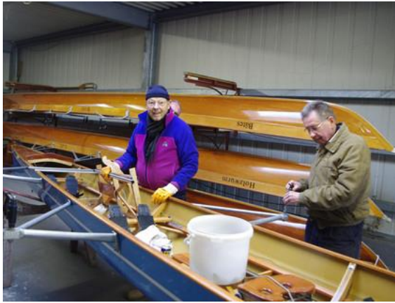
Dreck weg Tag