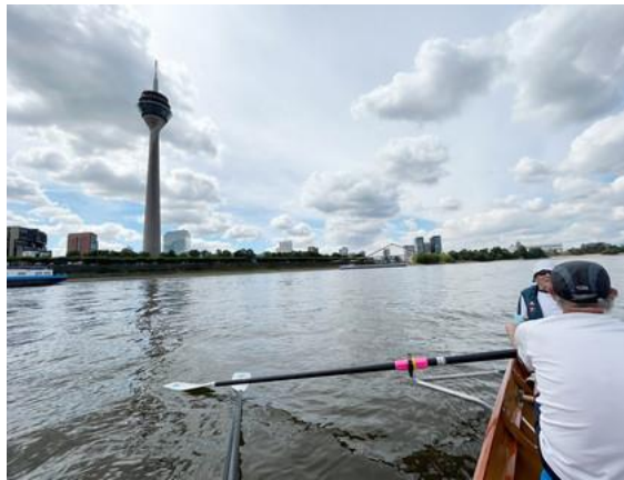
Sommernachtsrudern - Sommerfest