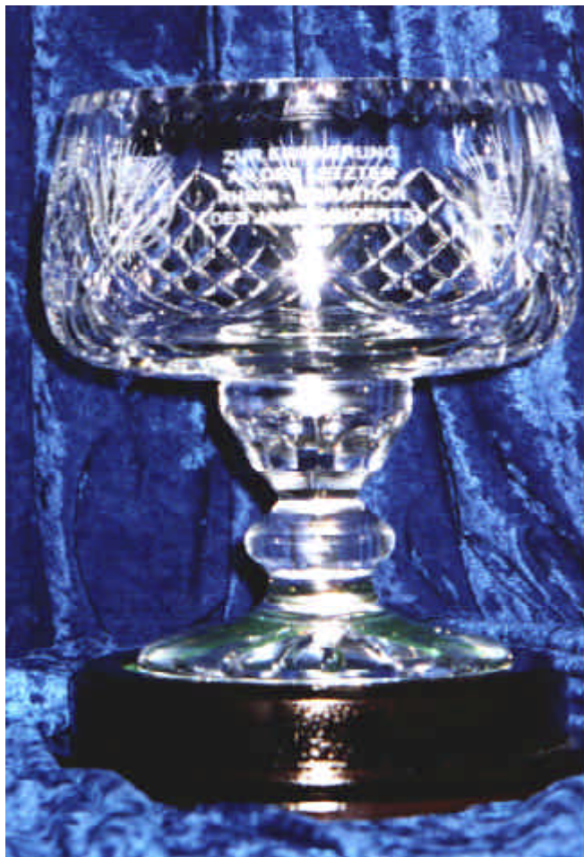
Freundschaftspokal des irischen Fermoy RC “Zur Erinnerung an den letzten Ruder-Marathon des Jahrhunderts”