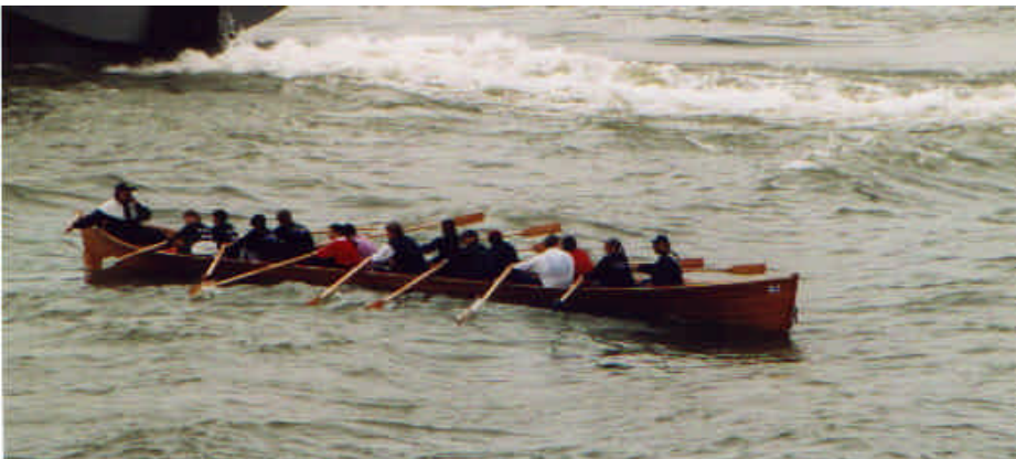
Finnisches Kirchboot auf dem Rhein - nicht auf der Ostsee

Komplette Regattaergebnisse stehen auf unserer Homepage unter http://members/tripod/~rcgd/